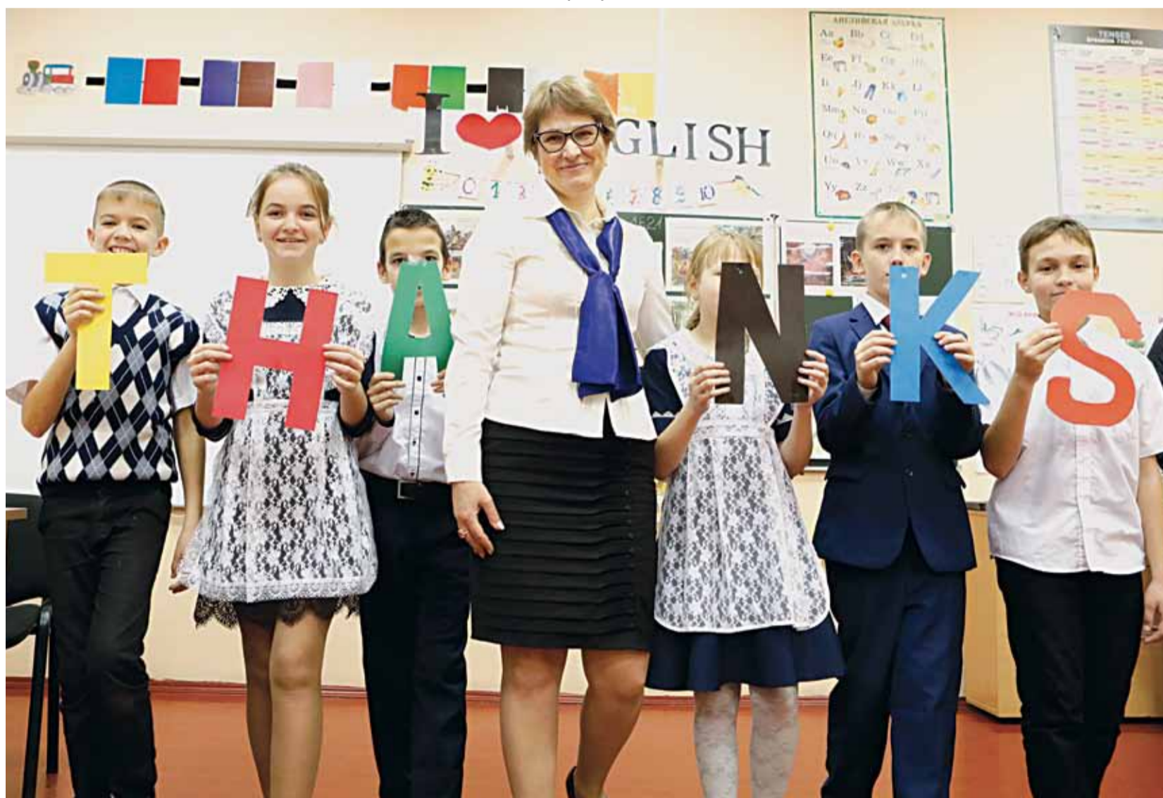
На дополнительных занятиях по английскому языку в Илёк-Пеньковской школе Краснояружского района

Школа полного дня — явление не новое для отечественной педагогической практики. Интерес к этой теме то утихает, то вновь возрастает. Новое осмысление она получила в связи с региональной стратегией «Доброжелательная школа», реализация которой рассчитана на 2019–2021 годы.