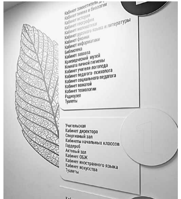
Элементы бережливых технологий в Краснояружской школе № 2