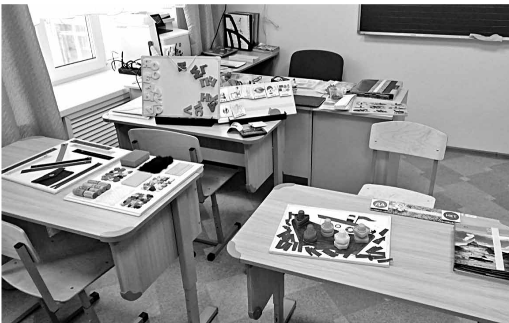
В творческой мастерской для детей с РАС

гружение работников в проблему, их изменившееся мышление и сознание. Специалисты не пытались создать видимость благополучия, а открыто говорили о трудностях, размышляли, рассказывали о поиске оптимальных методов и подходов.