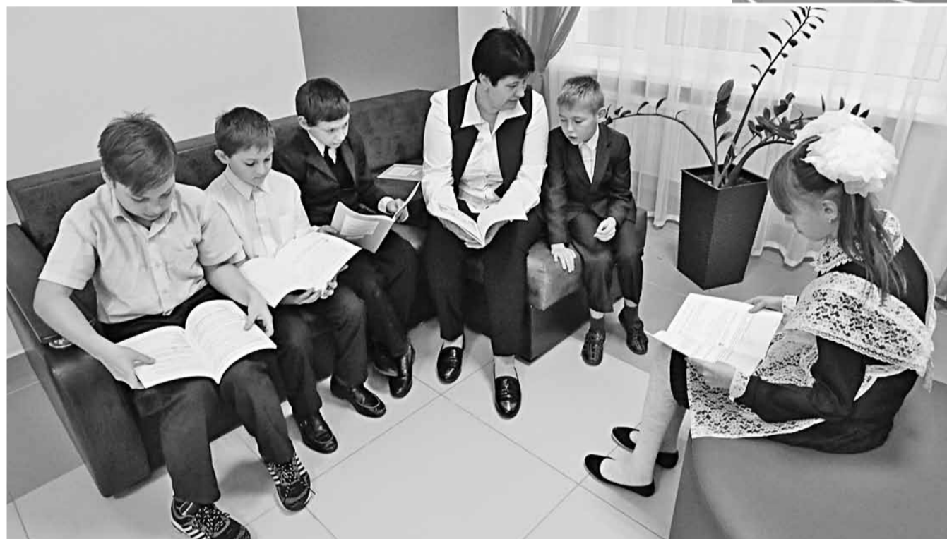
Зоны тихого отдыха в Вязовской школе Красноярского района