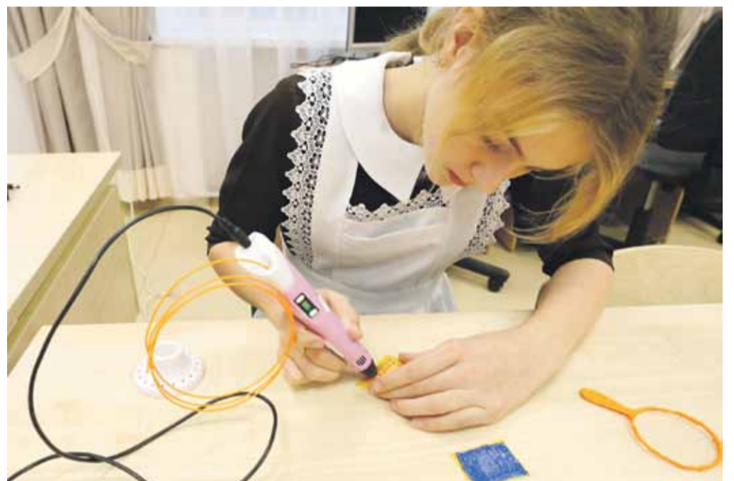
В Вязовской школе дети быстро освоили 3D-ручки