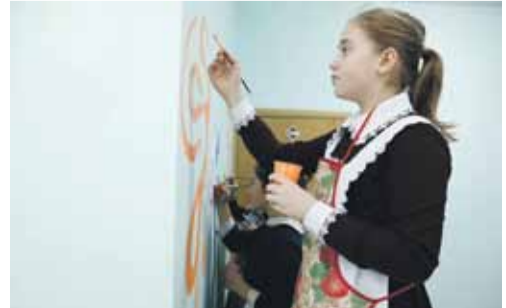
Ученики Степнянской школы сами разукрашивают стены