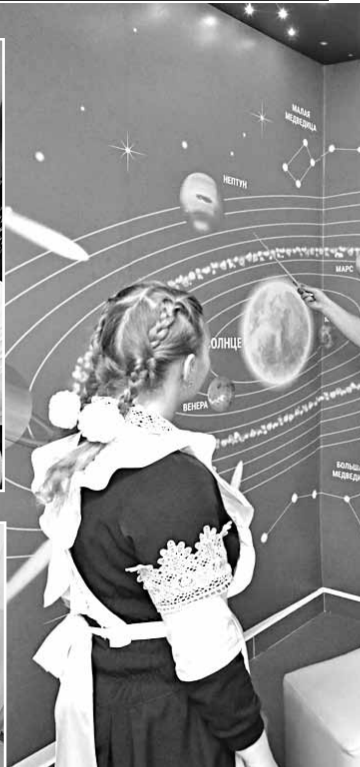
Астрономический уголок в Вязовской школе Красноярского района

Сегодня каждой школе законом разрешено самостоятельно осуществлять деятельность, разрабатывать и принимать локальные нормативные акты, содержащие нормы, регулирующие образовательные отношения. Отношение к принятию локальных нормативных актов должно меняться, оно должно быть заинтересованным со стороны не только педагогов, но и родителей. Не будем забывать, что родители — это равноправные участники образовательных отношений. Расписание — это такой же локальный нормативный акт. И если родители пренебрегли своим правом на участие в его обсуждении, а потом, когда расписание утвердили, стали упорно доказывать, что оно им не подходит, то это неправильно. Тем более что нелинейное расписание имеет право на существование. Главный довод в его пользу — это разнообразие занятий, а следовательно, условие сохранения здоровья и достижение необходимых результатов. Очень мудро поступили в Красноярской школе № 1, согласовав расписание с каждым родителем. Нужно уметь договариваться. Убеждён, что нет нерешаемых вопросов.