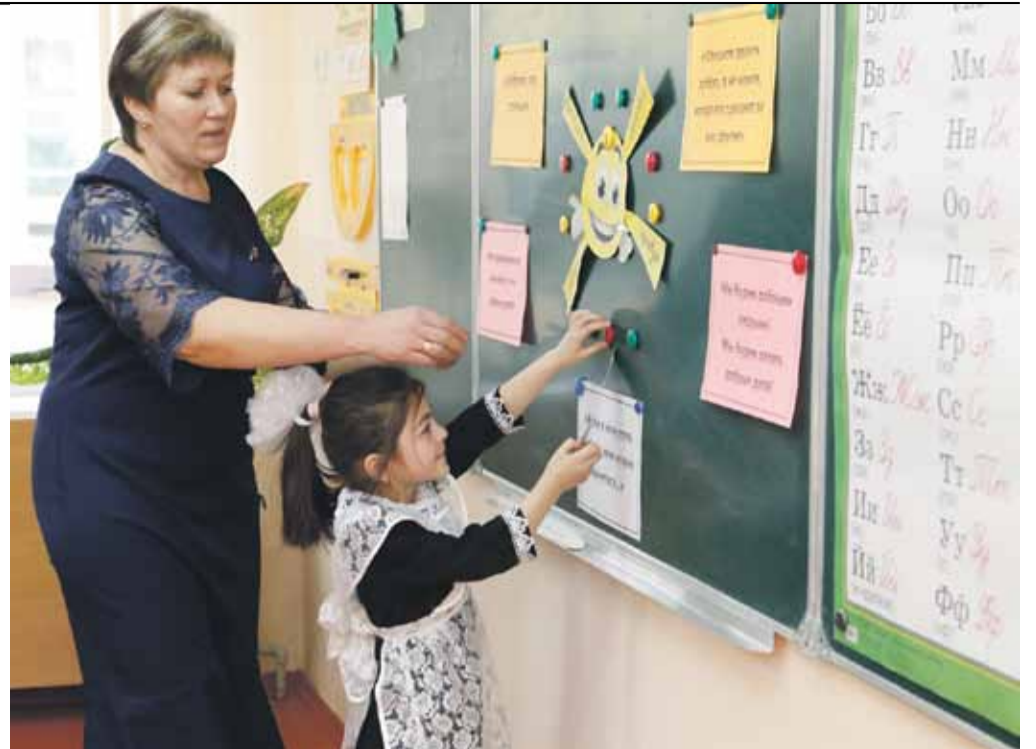
Урок в начальной школе села Степное