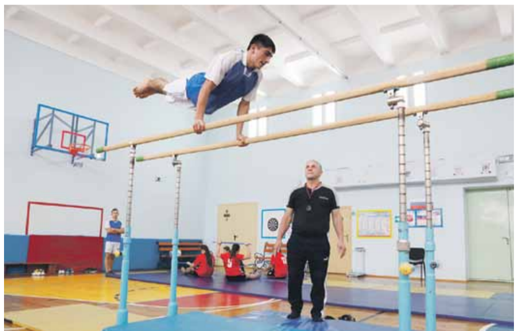
На внеурочных занятиях по спортивной подготовке в Степнянской школе