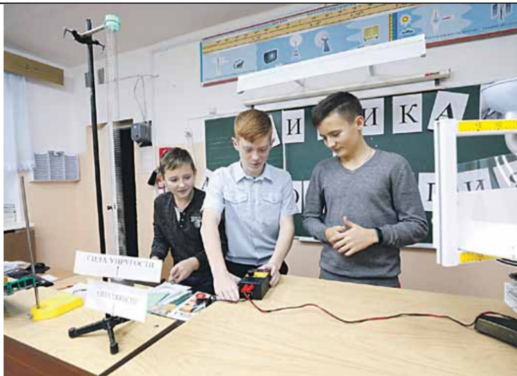
Занятия в кабинете физики. Школа № 1

А ещё школе повезло в том, что она построена единым комплексом с красноярским ФОКом. И школьники могут заниматься в его бассейнах, тренажёрных и спортивных залах. Мало того, по рекомендации врачей мальчишки и девчонки могут в ФОКе бесплатно пройти курс массажа!