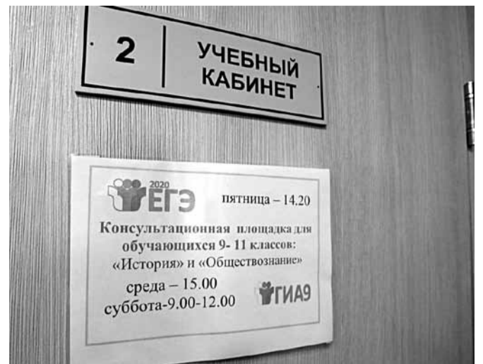
Консультационные площадки в Краснояружской школе № 2