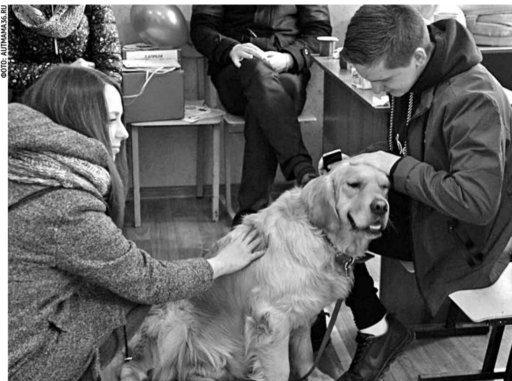
По инициативе воронежской организации «АутМама» используется канистерапия — лечение через общение с собаками

В работе с детьми с РАС в Воронеже активно применяют гончарное дело, для этого в школах создали гончарные мастерские. Через глину дети с РАС привывают друг к другу. Лепка развивает не только мелкую моторику, но и абстрактное мышление, которого у детей с РАС практически нет. В