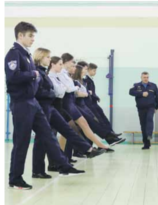
Строевая подготовка у кадетов в школе № 2