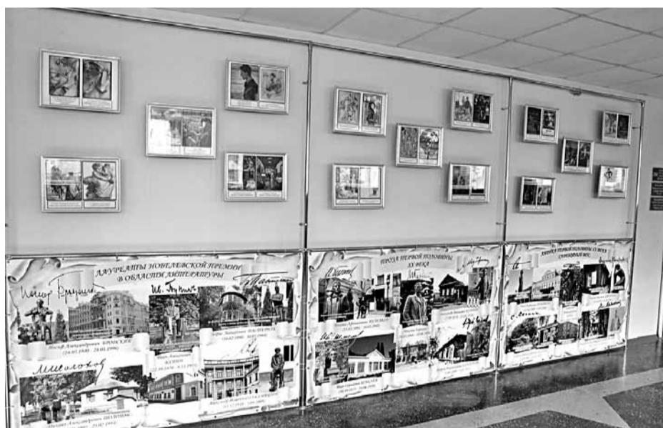
Образовательная зона лицейского литературного музея

На классных часах учителя рассказывают школьникам о способах применения бережливых инструментов на личном рабочем месте. Для