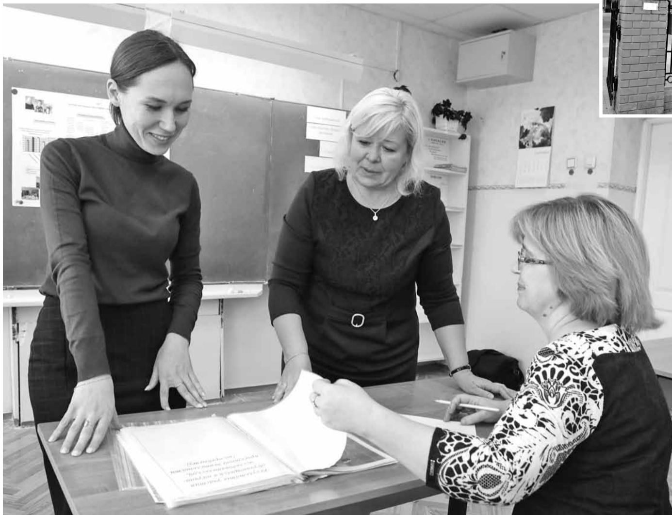
Работа с наставником