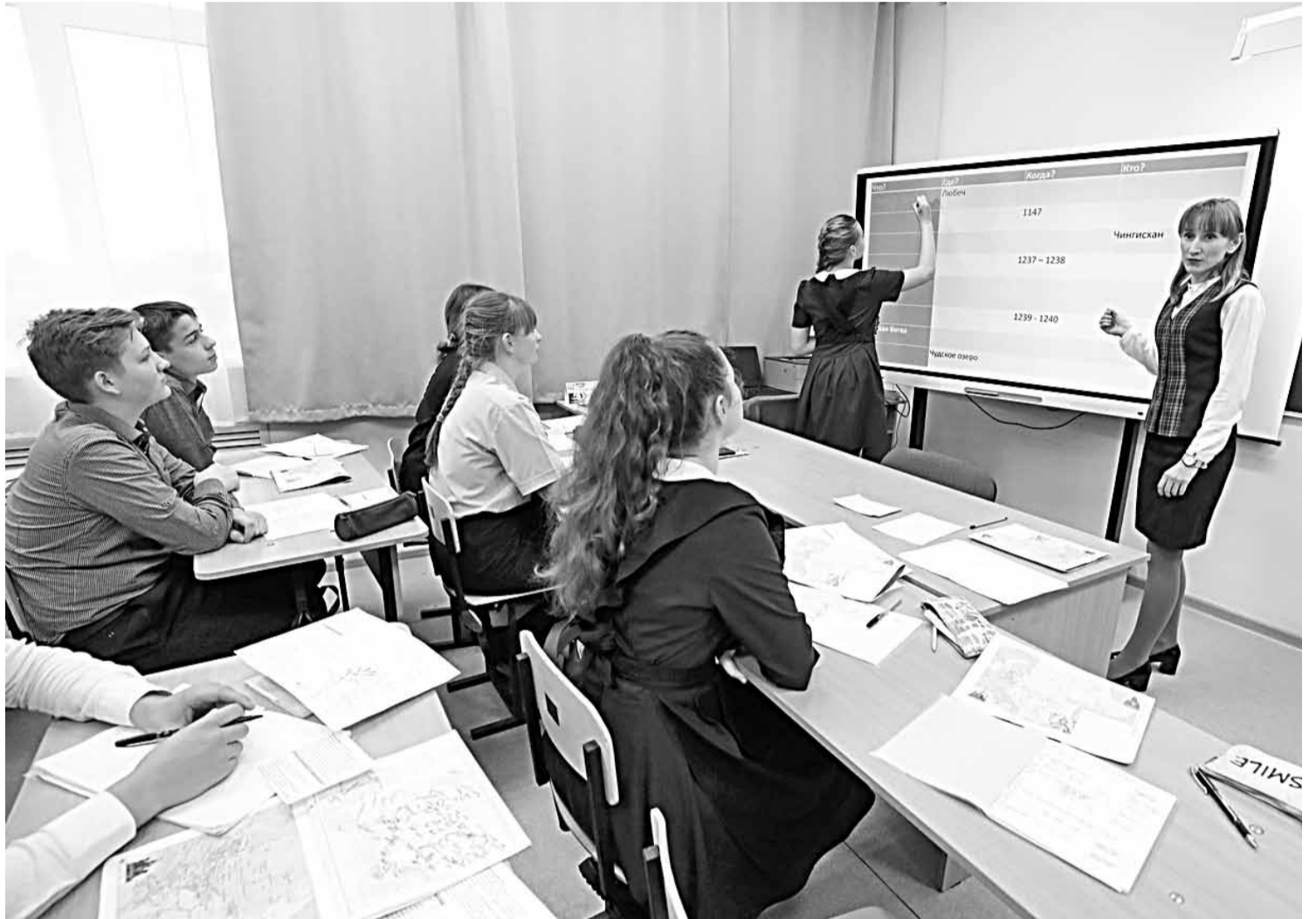
Несколько смарт-досок для школ района приобрели в рамках нацпроекта «Образование»

Почему только час? Потому что расписание очень насыщенное. И учебными делами детям нужно заниматься дозированно, иначе проку никакого не бу-