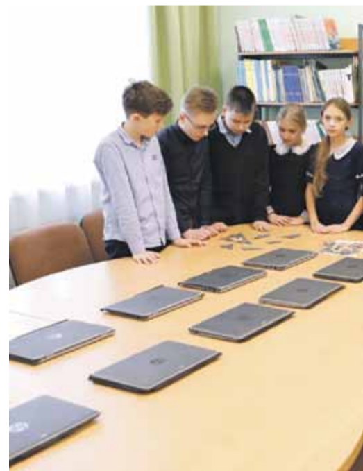
В библиотеке школы № 2