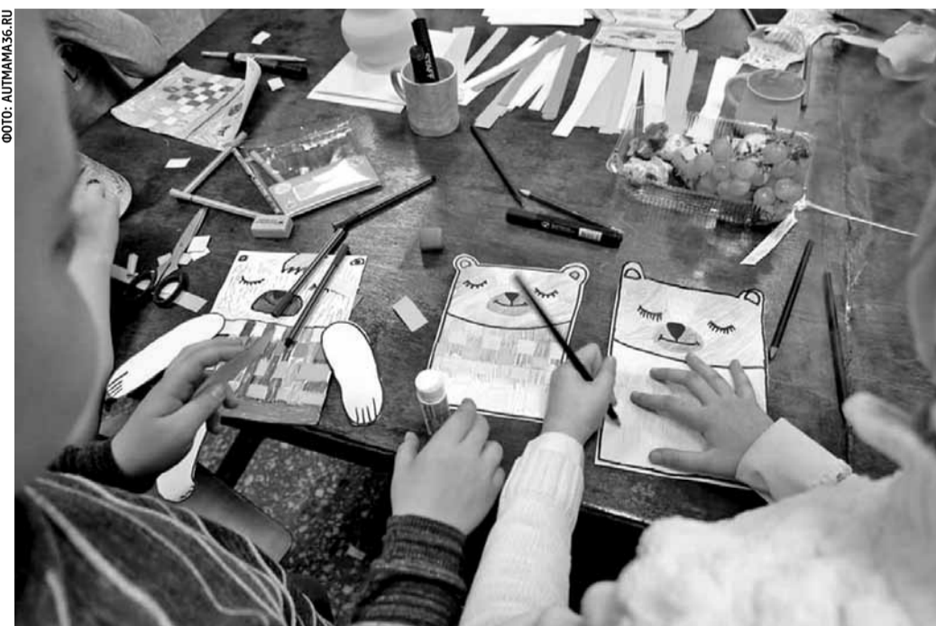
Мастерские для детей-аутистов в Воронеже

долгосрочной перспективе здесь намерены сделать глиняные поделки источником заработка для своих особенных детей. Вопросы распространения воронежского опыта по применению гончарного дела в районах и городских округах Белгородской области будут курировать заместители глав органов местного самоуправления по социальным вопросам.