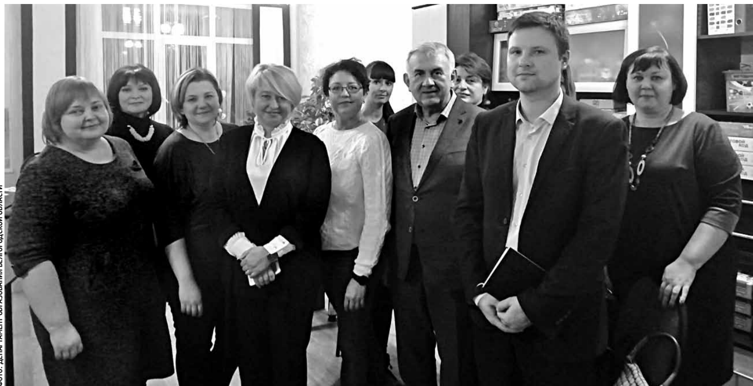
Белгородская делегация в гостях у воронежских коллег

Так же, как и в Белгородской области, в Воронежской действуют различные фонды, региональ-