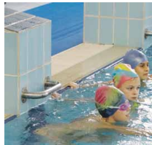
Ученики школы № 2 занимаются в бассейне ФОКа