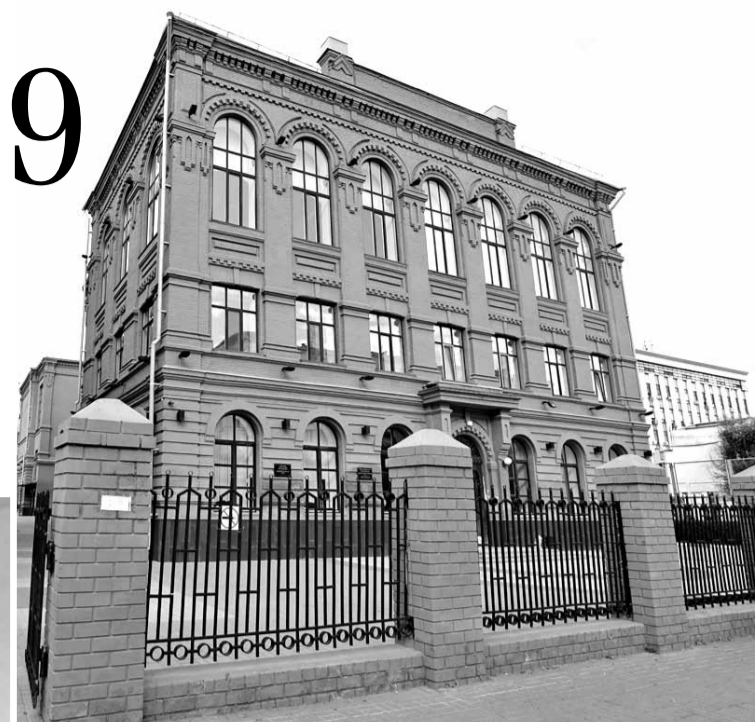
Лицей № 9

— Использование картирования позволило выявить проблемные места в образовательной деятельности и проанализировать возможности их устранения. Сейчас в лицее разработан 21 бережливый проект, шесть из которых уже реализованы.