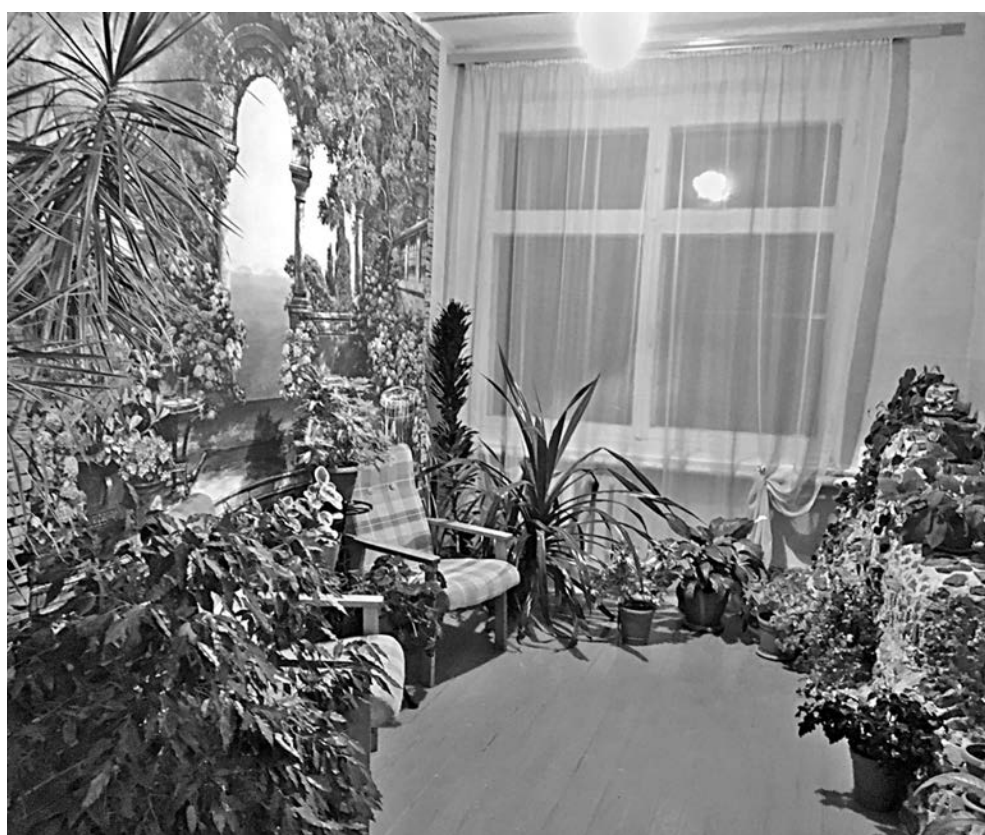
Зимний сад в Васильдольской школе