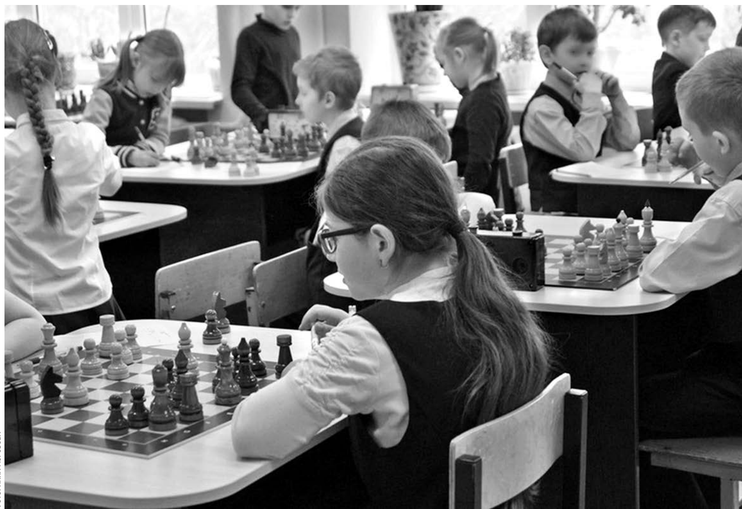
В образовательном комплексе «Луч»

— Высокий уровень локального нормотворчества. В этих учебных заведениях есть хорошо проработанные локальные нормативные акты, которые обеспечивают порядок. Основные образовательные программы и программы развития направлены на активное познание мира, развитие учебно-исследова-