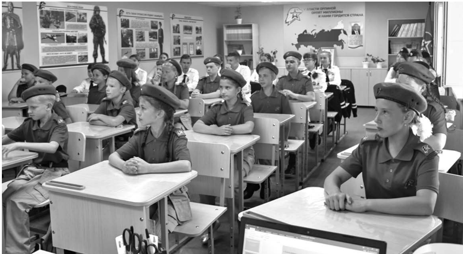
Кадетский класс школы № 1

В результате реализации проекта в школе создали лабораторию, которую можно без преувеличения назвать кузницей пытливых, талантливых юных исследователей. Ученики от четвёртого до выпускного классов занимаются наукой. В рамках постпроектной деятельности рядом с лабораторией оформлена развивающая зона «Химия занимательная и увлекательная», которая рассказывает об опытах,