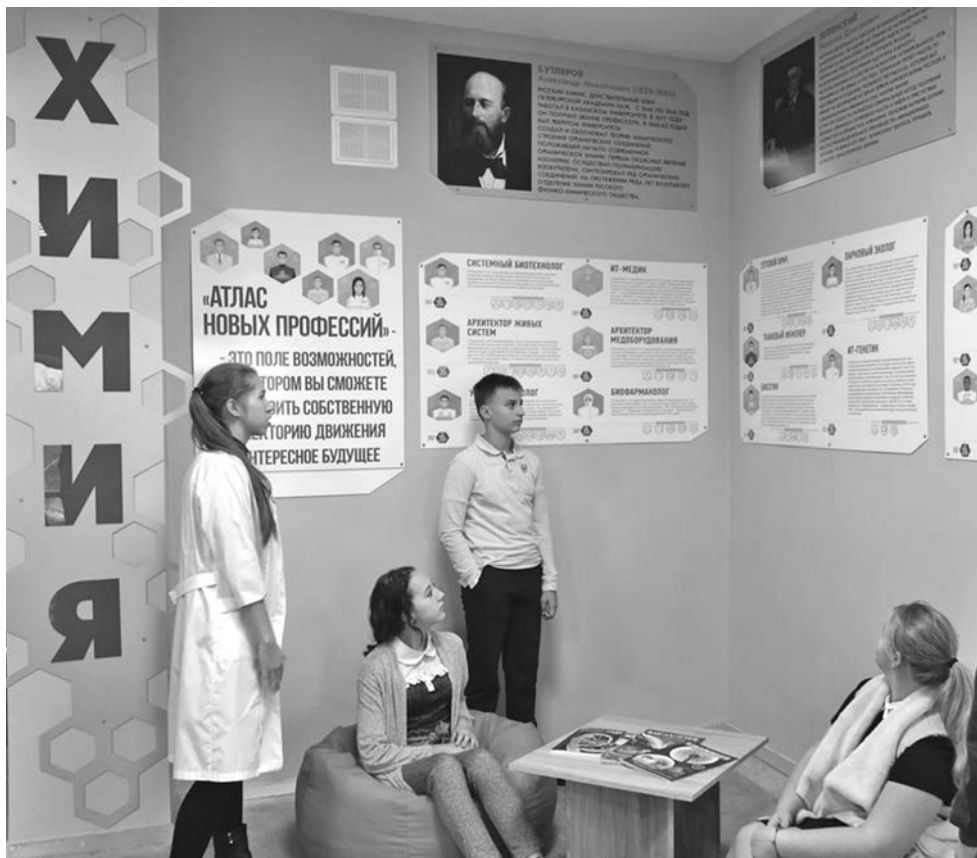
Профориентационная зона в школе № 1