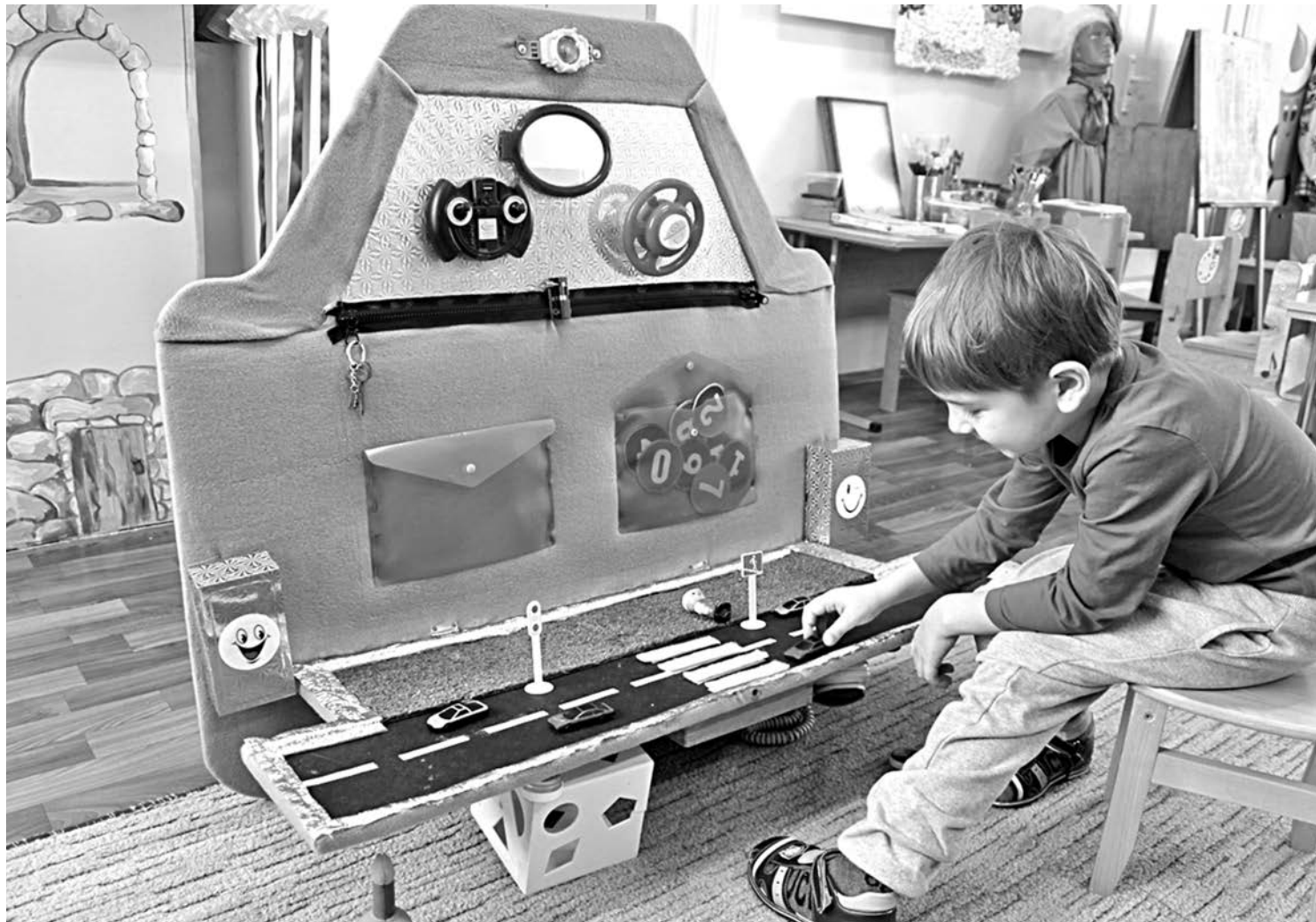
Игровая зона в детском саду № 8

СЕГОДНЯ СВОИМ ОПЫТОМ ДЕЛЯТСЯ УЧРЕЖДЕНИЯ ОБРАЗОВАНИЯ НОВООСКОЛЬСКОГО ГОРОДСКОГО ОКРУГА