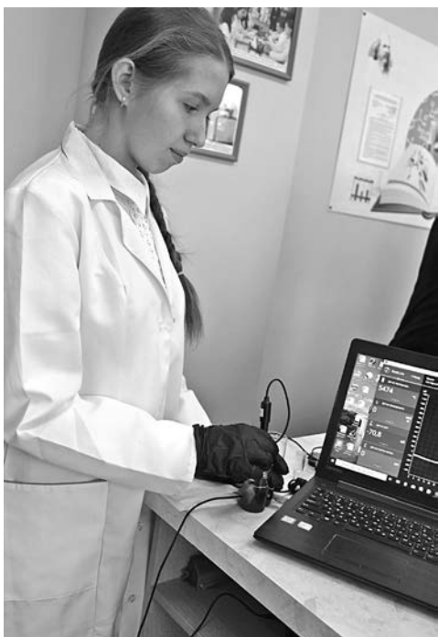
В школе № 1

КОЛЛЕГИ! МЫ ПРИГЛАШАЕМ ВАС СТАТЬ НЕ ТОЛЬКО ЧИТАТЕЛЯМИ, НО И АВТОРАМИ ГАЗЕТЫ!