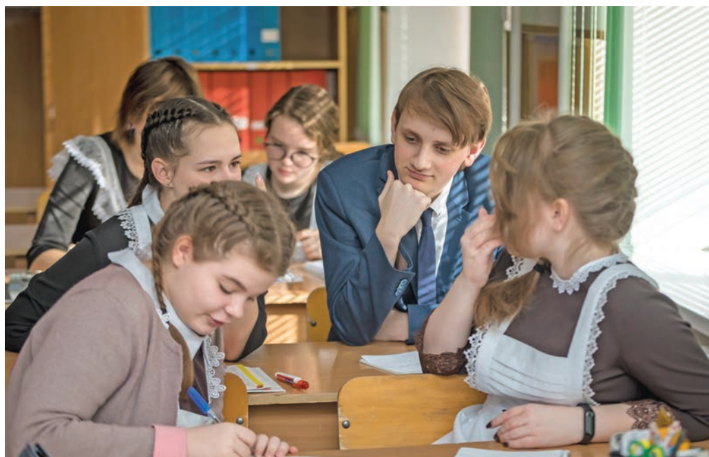
Урок обществознания в 10-м «Б» классе

Ольга МУШТАЕВА » ТЕКСТ, Павел КОЛЯДИН » ФОТО