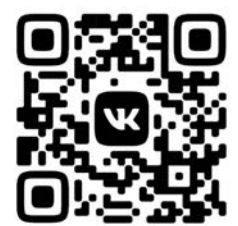
ПАБЛИК В СОЦСЕТИ «ВКОНТАКТЕ» HTTPS://VK.COM/KAFEDRA_DZOT

Созданная группа в соцсети позволит учителям физкультуры оперативно обмениваться лучшими практиками, делиться опытом регионов, конкретных образовательных учреждений.