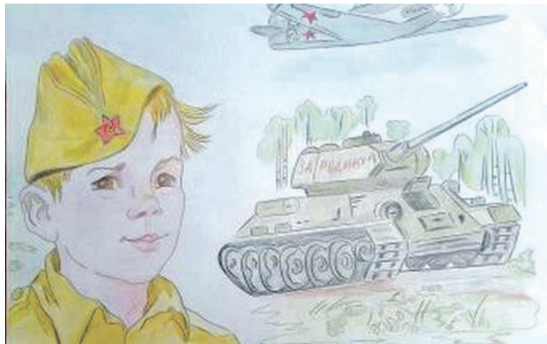
Рисунок Дарьи Лопиной (Корочанская школа им. Д. Кромского)