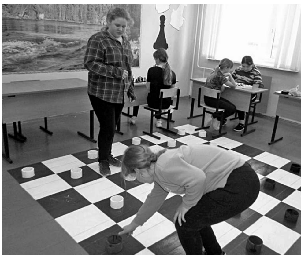
Игровая зона в Глинской школе