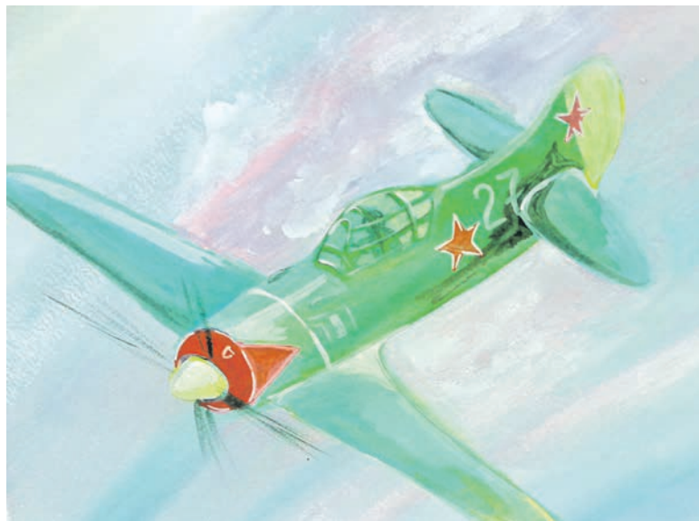
Воздушный бой. Рисунок Дмитрия Новикова (Корочанская школа им. Д. Кромского)