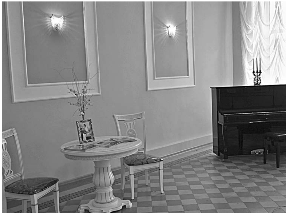
Ольгинский зал школы № 1