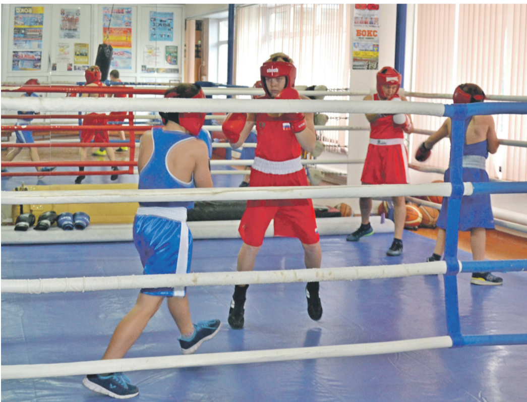
Тренировки по боксу в школе № 4