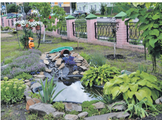
Ландшафтный дизайн на территории школы № 2