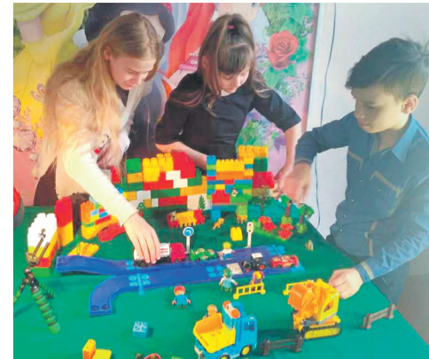
Студия мультипликации в Доме детского творчества