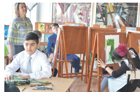
В изостудии школы № 4