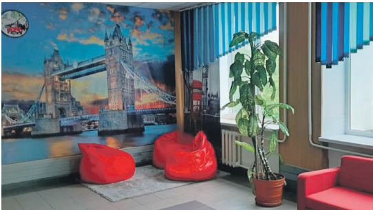
Рекреационная зона в школе № 1