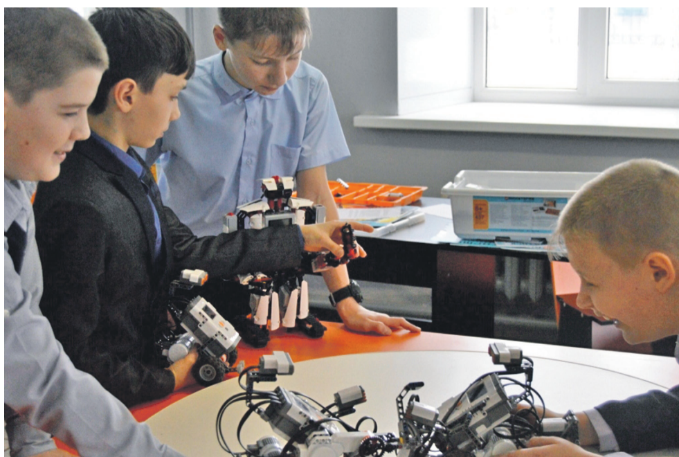
Технопарк в школе № 1

Ещё один важнейший элемент современной инфраструктуры — создание цифровой образовательной среды. Для решения проблемы взаимоотношений «цифровые ученики и нецифровые» учителя создали школьный медиаклуб «МедиаДикт».