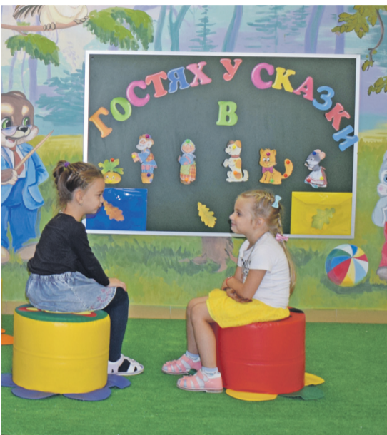
В детском саду № 4