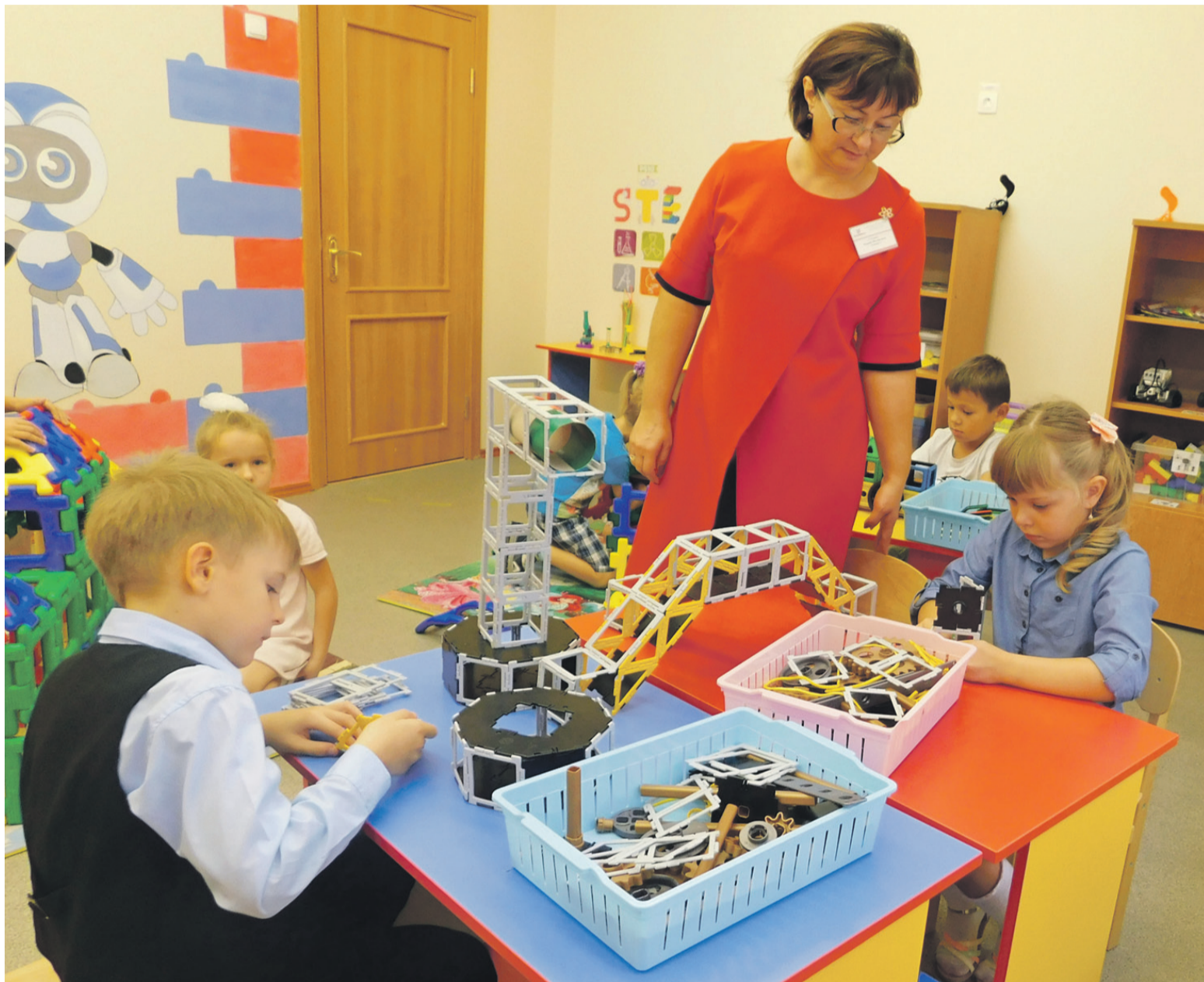
Инженерное образование малышей начинается с конструирования

Школьный технопарк позволяет создать эффективную систему профориентации, популяризировать среди школьников и их родителей востребованные инженерные и технические специальности. И, конечно, помогает выявить «техно-звёздочек» среди учеников в сетевом взаимодействии образовательных учреждений города.