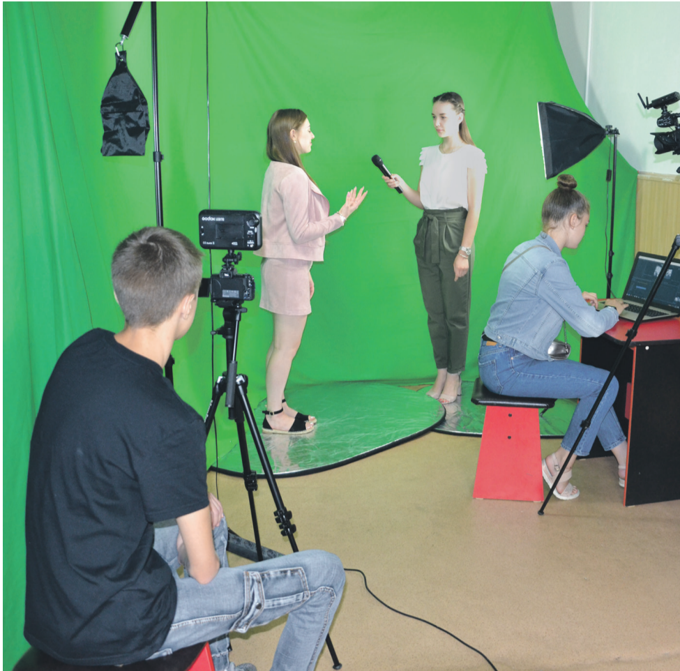
В школьном медиацентре «МедиаДикт» школы № 1